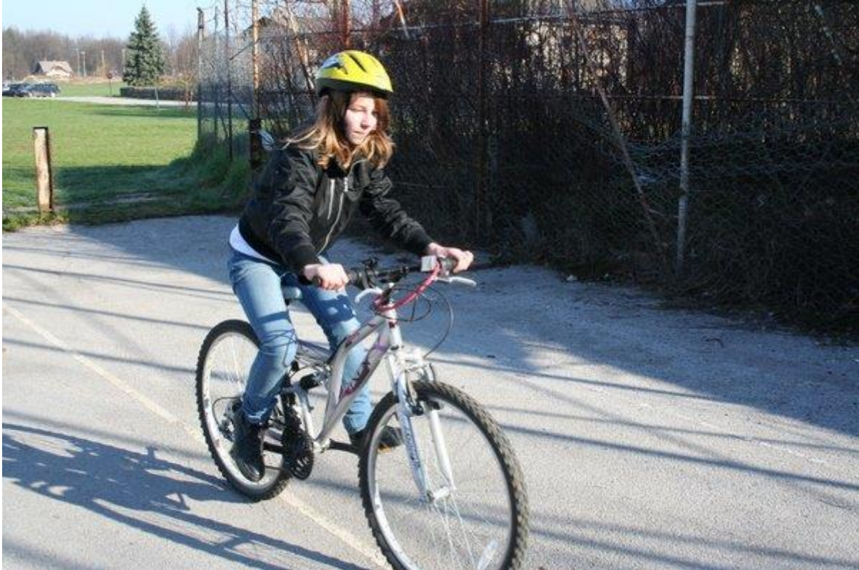
Kolesarka s tehnično brezhibnim kolesom in čelado

Otroci naše šole so v promet vključeni na različne načine. Nekateri pridejo v šolo kot pešci, kot sopotniki v osebnih vozilih, kot potniki v avtobusu, nekateri občasno celo s kolesom. Ker imajo otroci manj izkušenj in zaradi svojih psihofizičnih lastnosti, so v prometu še posebej ogroženi. Zaradi navedenega Zakon o varnosti cestnega prometa navaja in poudarja, da morajo biti otroci kot udeleženci v cestnem prometu deležni posebne pozornosti in pomoči drugih udeležencev.