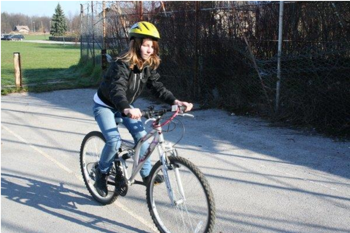
Kolesarka s tehnično brezhibnim kolesom in čelado

Otroci naše šole so v promet vključeni na različne načine. Nekateri pridejo v šolo kot pešci, kot sopotniki v osebnih vozilih, kot potniki v avtobusu, nekateri občasno celo s kolesom. Ker imajo otroci manj izkušenj in zaradi svojih psihofizičnih lastnosti, so v prometu še posebej ogroženi. Zaradi navedenega Zakon o varnosti cestnega prometa navaja in poudarja, da morajo biti otroci kot udeleženci v cestnem prometu deležni posebne pozornosti in pomoči drugih udeležencev.