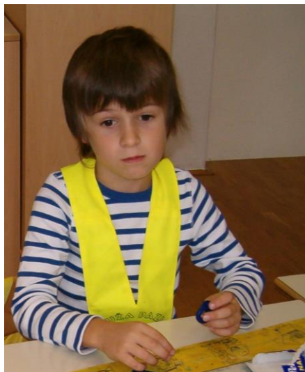
Učenka z rumeno rutico

Jutranje varstvo je organizirano za učence 1. razreda na matični šoli, na podružnici Dolenja vas in na podružnici Sušje.