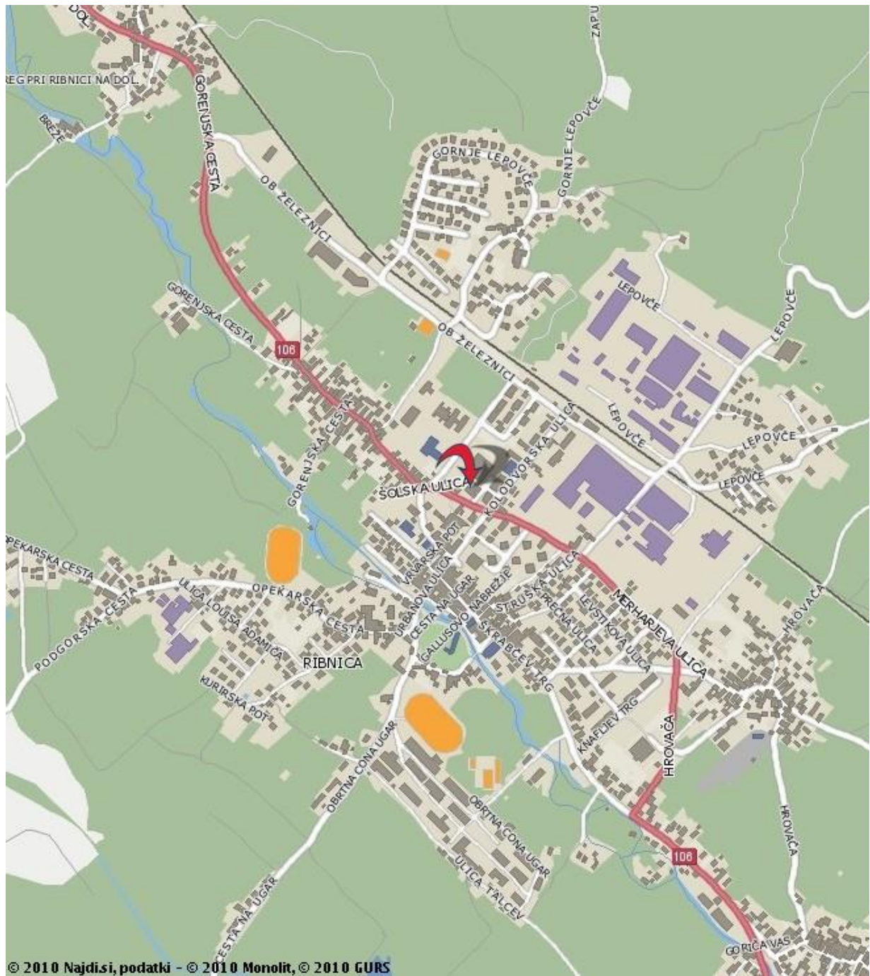
Zemljevid bližnje okolice šole in cest