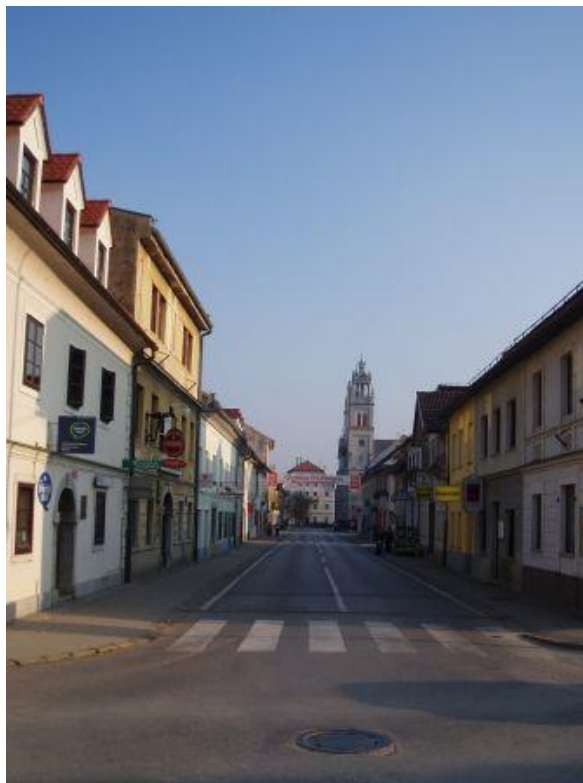
Center Ribnice z nevarnim ozkim delom pločnika ob Johanovi hiši