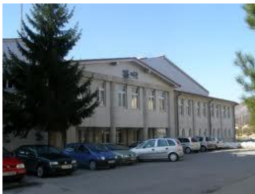
Prostorno parkirišče ob ŠC Ribnica