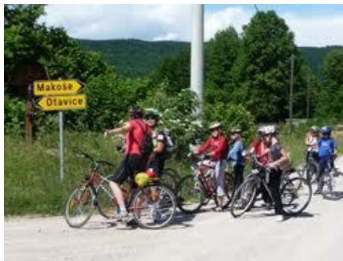
Izlet s kolesi (učenci predmetne stopnje)

Učenci 5. razreda skupaj s starši poskrbijo za tehnično ustreznost kolesa, kar potrdi policist ali pooblaščenca oseba z izdajo nalepke »varno kolo«. Učenci ob pisnem dovoljenju staršev opravijo teoretični preizkus znanja in praktično vožnjo na spretnostnem poligonu in na cesti. Z uspešno izkazanim znanjem si pridobijo izkaznico o opravljenem kolesarskem izpitu. Starši s podpisom izkaznice potrjujejo, da bodo skrbeli za tehnično ustreznost kolesa in da dovolijo kolesarjenje na javnih prometnih površinah.