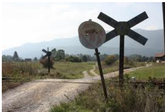
Prehod pri vasi Hrovača