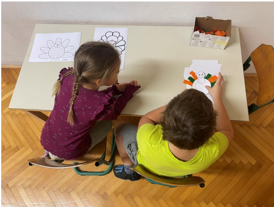
Učenci 3. f in učiteljica Aida Krešić