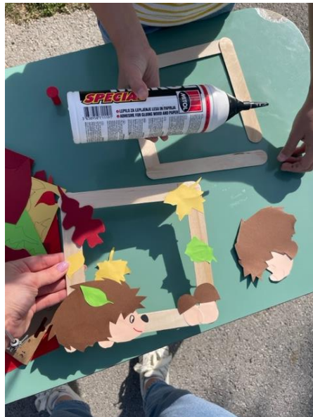
Učenci 4.d in 5.f razreda z učiteljico Nastjo Tomsič