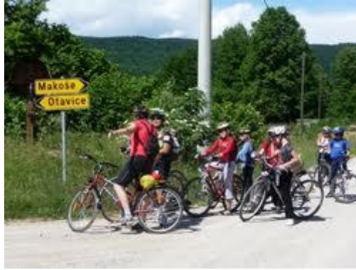
Izlet s kolesi (učenci predmetne stopnje)