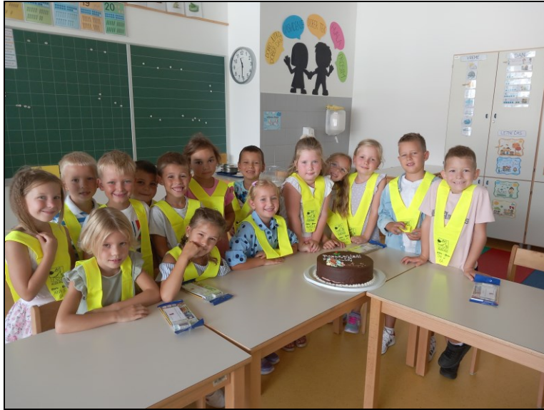
Prvošolčki z rumenimi ruticami

Jutranje varstvo je organizirano za učence 1. razreda na matični šoli, na podružnici Dolenja vas in na podružnici Sušje.