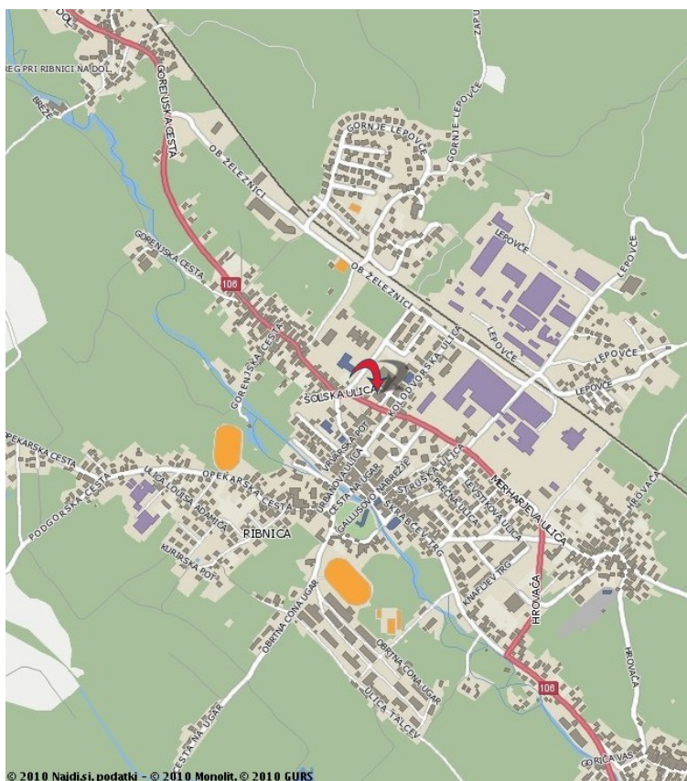
Zemljevid bližnje okolice šole in cest

Zato je zaradi sorazmerno gostega prometa, dotrajanih ali slabo vzdrževanih in ozkih cest nepravilna hoja ali vožnja s kolesom povsod nevarna. Učenci hodijo in vozijo mirno in opazujejo promet okrog sebe . Posebno nevarna so križišča, avtobusna postajališča in vsi prehodi čez železniško progo (nekateri so še brez zapornic).