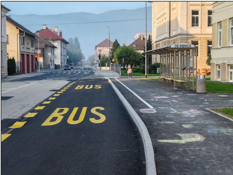
Prenovljeno avtobusno postajališče pred OŠ Ribnica