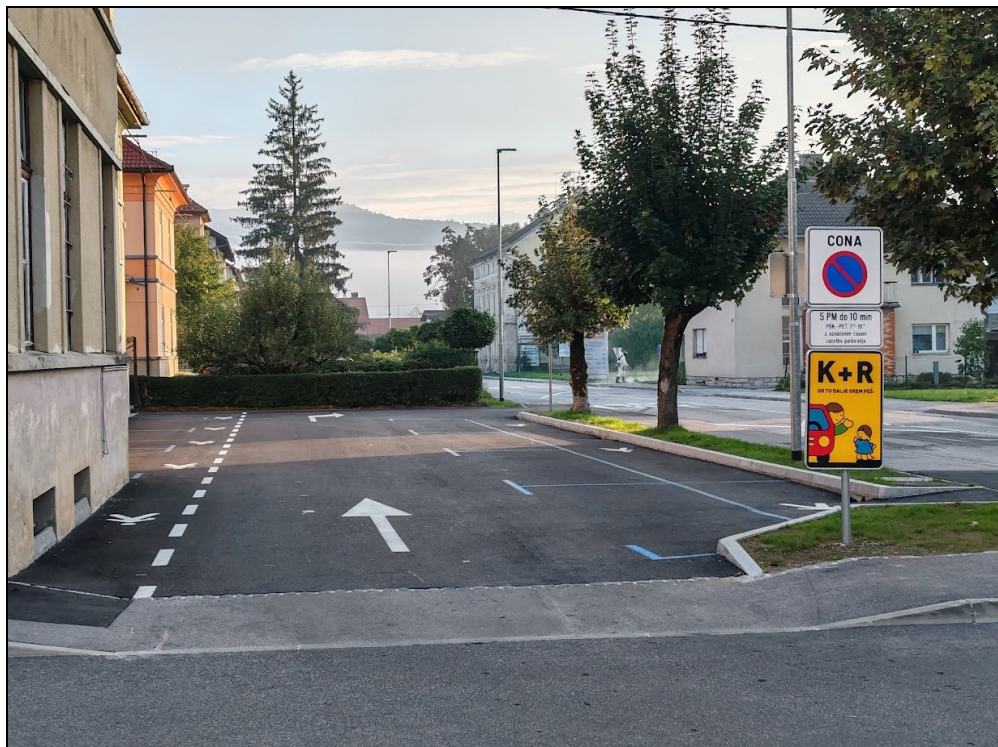
Na novo asfaltirano parkirišče pri TVD Partizanu, ki je namenjeno časovno omejenemu parkiranju