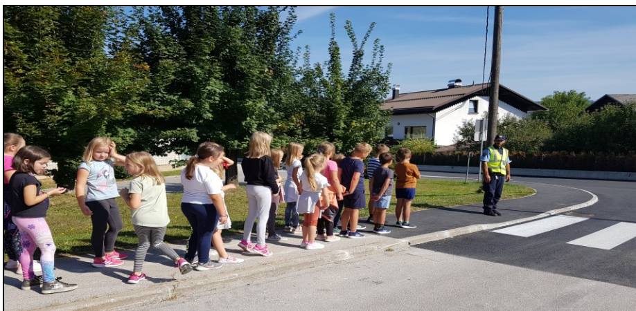
Učni sprehod s policistom za učence prve triade

Promet se je v zadnjih letih bistveno povečal, zato so najbolj izpostavljeni v prometu pešci, predvsem mlajši. Učence je potrebno vsakodnevno opozarjati na varno hojo v šolo in domov. Že v začetku šolskega leta se pri razrednih urah učenci pogovorijo z razrednikom o varnih poteh v šolo. Za učence 1., 2. in 3. razredov so organizirane tudi učne ure s policisti Policijske postaje Ribnica. Veliki poudarek damo na kulturno obnašanje v prometu, poznavanju pravil v prometu, predvsem v situacijah, v katerih se lahko znajdejo učenci na kateri izmed šolskih poti.