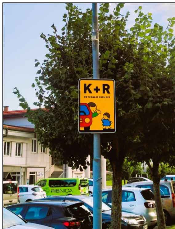
K + R, kar pomeni »Kiss & Ride« ali »Poljubi in odpelji«