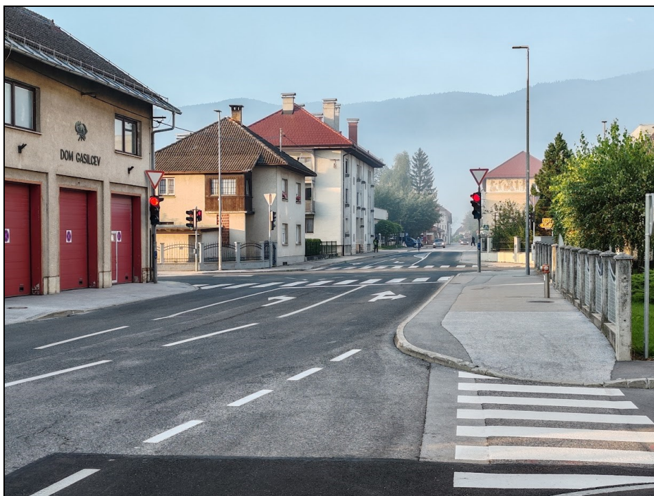
Glavno semaforizirano križišče v Ribnici